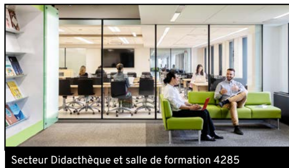
Secteur Didacthèque et salle de formation 4285