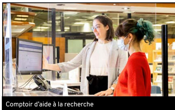
Comptoir d'aide à la recherche