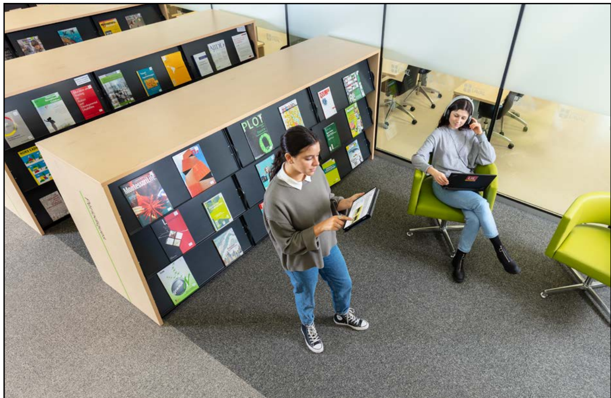
Bibliothèque au pavillon J.-C.-Bonenfant, 4 e étage

Pour obtenir plus d'informations, visitez le bibl.ulaval.ca .