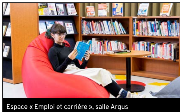
Espace « Emploi et carrière », salle Argus