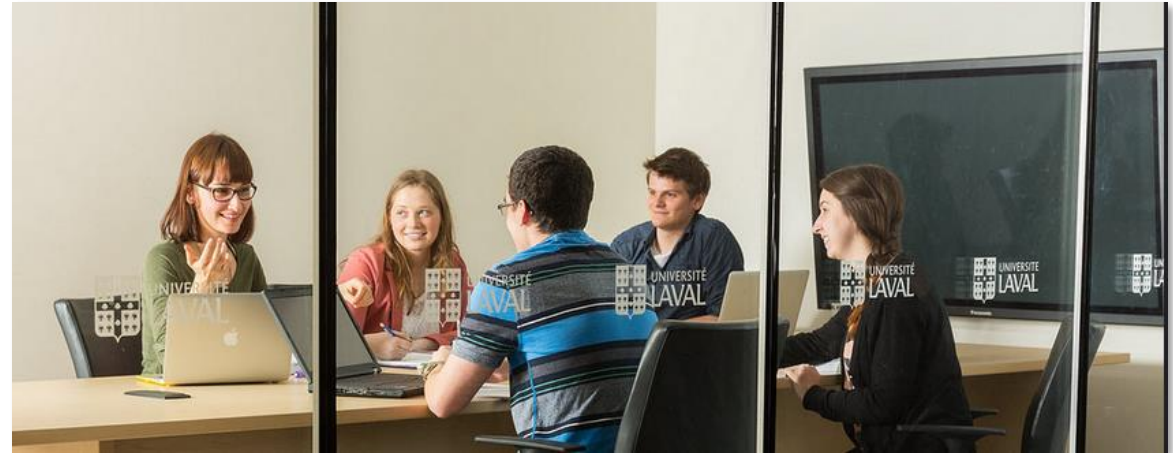
Espace de travail en équipe (4 e )